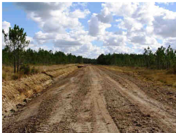
Piste du Moulin