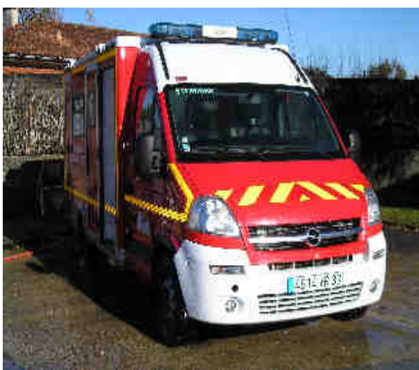
La nouvelle Ambulance

Matériel : Dernièrement la caserne de Salaunes s'est vue dotée d'une nouvelle ambulance avec un équipement en matériel encore plus complet que l'ancienne, mais surtout avec un brancard monté sur vérins hydrauliques qui rend le transport de la victime vraiment plus confortable. Une cellule arrière équipée de la climatisation beaucoup plus spacieuse facilite le travail de l'équipe. Vu le coût du véhicule 90.000 euros on peut dire que le père Noël est passé à la caserne avant l'heure.