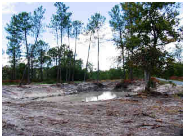
Point d'eau les Sablons